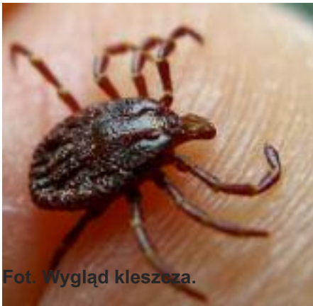
Fot. Wygląd kleszcza.

Z robiło się ciepło. Przebywamy dużo na świeżym powietrzu. Korzystamy z chłodu lasu i wody. Czasami przyjemności te odpłacają się nam mało przyjemnie. Dzielimy się środowiskiem z innymi organizmami, które mogą przyczyniać się do rozwoju chorób określanych jako wektorowe.