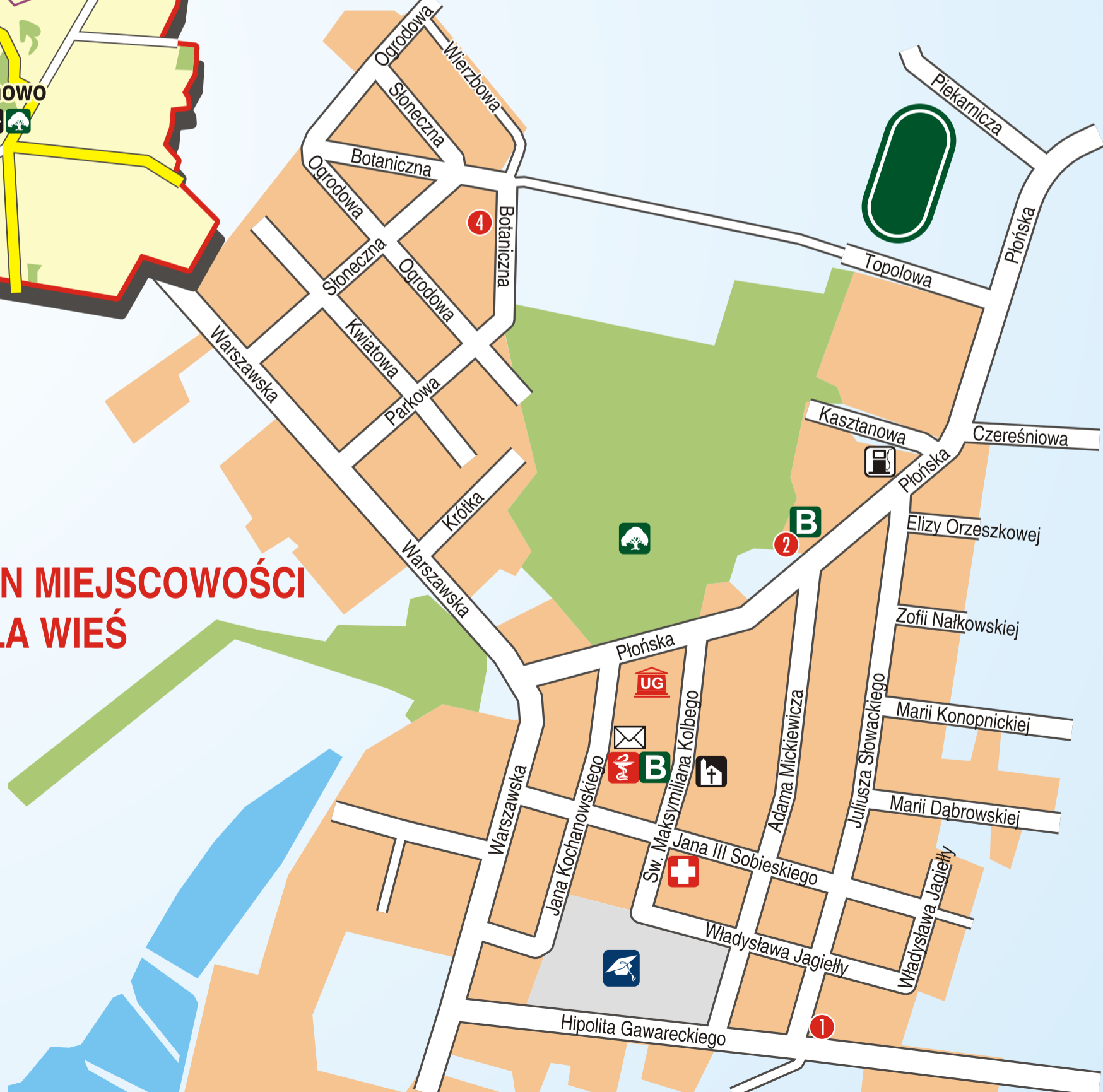
PLAN MIEJSCOWOŚCI MAŁA WIEŚ