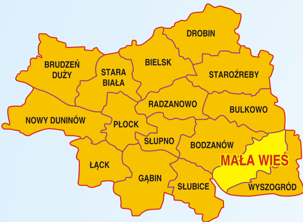
MAPA GMINY MAŁA WIEŚ